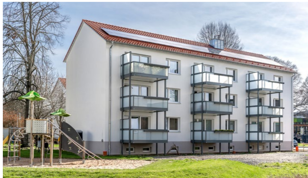
Neue Balkone und eine PV-Anlage mit Speicher wurden installiert

Die Belastung der Mietenden, die während der Maßnahmen größtenteils weiter in ihren Wohnungen gelebt haben und Lärm und Schmutz ausgesetzt waren, war hoch. Vereinzelt wurde das Umquartieren in alternative Unterkünfte unumgänglich. Trotz allem sind wir sehr zufrieden mit den Ergebnissen. Alle sanierten Gebäude gehören nun zum KfW-Effizienzhaus-55-Standard.