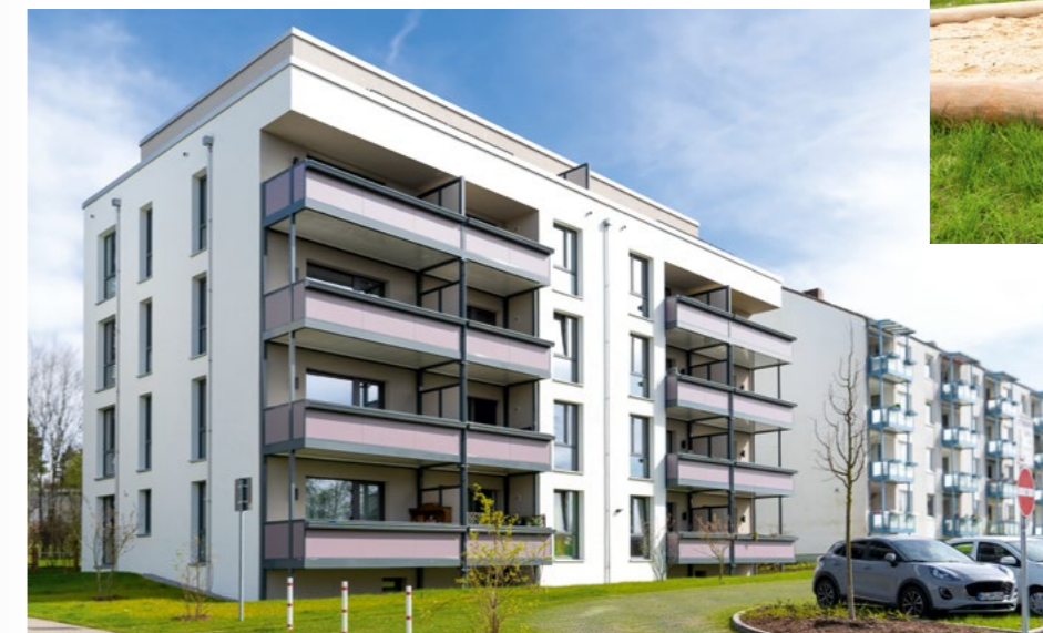
Der Neubau mit 18 Wohneinheiten