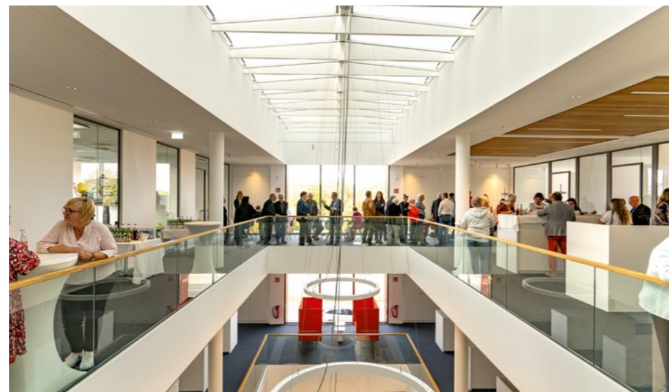
Im Foyer wurde gegessen, getrunken und geplaudert