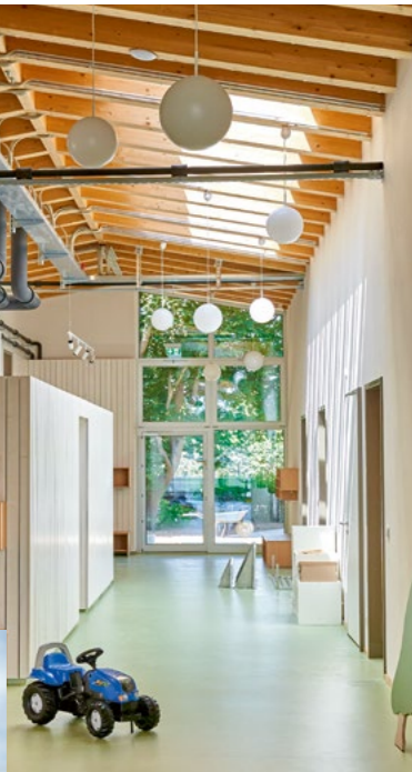
Die Bewegungs-KiTa in Grone