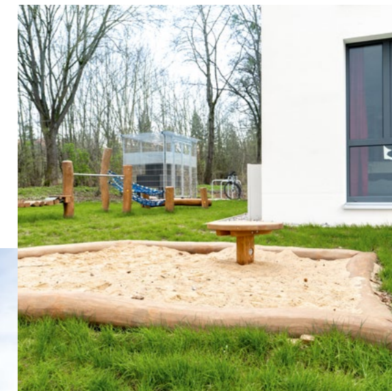
Der Spielplatz mit Kletterparcour und Sandkasten

Die Vermietung wurde bereits frühzeitig vorbereitet und das Interesse an den neuen Wohnräumen war ausgesprochen groß. Besonders die kleinen Einheiten mit größtenteils offen angelegten Küchen und die unverbaute Aussicht aus dem Staffelgeschoss sorgten für Begeisterung. Entsprechend schnell konnten alle Wohnungen vermietet werden. Die neuen Bewohnenden der Weserstraße 51a kommen aus allen Generationen und fühlen sich in der Gemeinschaft und im neuen Zuhause sehr wohl.